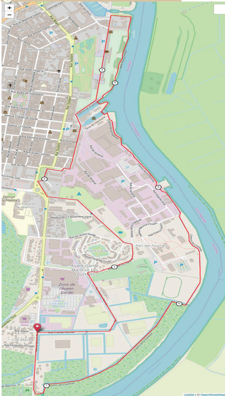
Foules du transbordeur [ 7558 m - 7.56 km ]